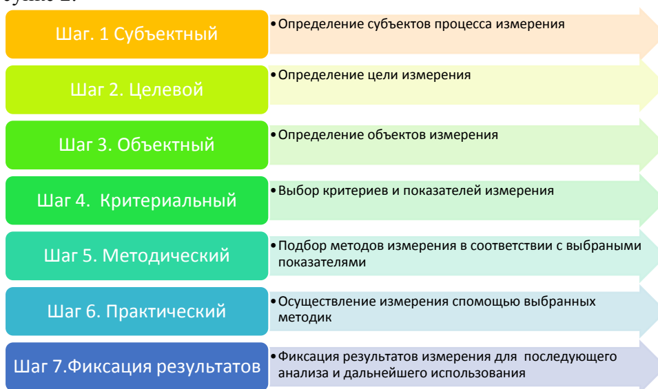
Рис. 2 Алгоритм измерения инноваций

Указанные этапы могут быть разделены на 7 шагов, которые представлены на рисунке 2.